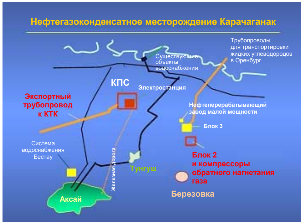
Рис. 1. Схема нефтегазоконденсатного месторождения Карачаганак

Реализация проекта предполагает: 1) углубление и капитальный ремонт 85 скважин; 2) реконструкцию существующей установки первичной сепарации и сооружение дополнительной установки; 3) сооружение установки по сепарации конденсата нефтяного газа и установку компрессоров для нагнетания природного газа; 4) строительство 636-километрового трубопровода для перекачки жидких углеводородов и его соединение с нефтепроводом Каспийского трубопроводного консорциума (КТК) для экспорта добываемых на месторождении жидких углеводородов; 5) природоохранные мероприятия на действующей площадке (в связи с загрязнением, имевшим место во времена Советского Союза); и 6) создание на территории месторождения сети внутрипромысловых трубопроводов, дорог и соответствующей инфраструктуры, включая строительство энергоустановки мощностью 120 МВ для обеспечения электроэнергией самого проекта и местного населения. Строительные работы были завершены к концу 2004 года.